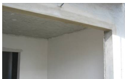
Aspetto final com talochamento