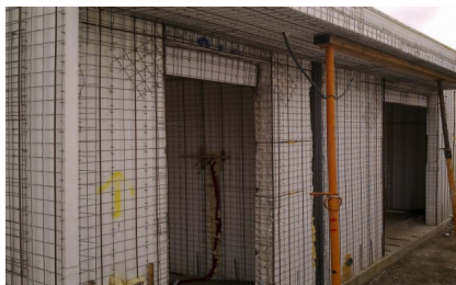
Preparação do suporte