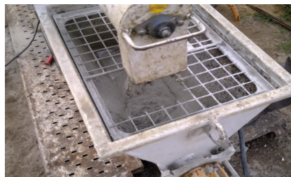
Amassadura do BETÃO-S PROJ 25