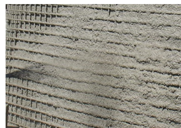
Aplicação da primeira camada