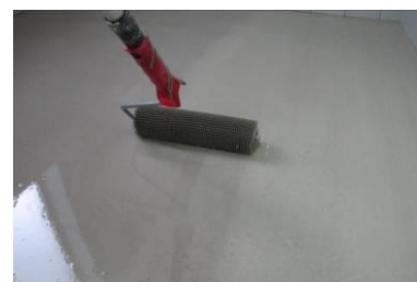
Uniformização da superfície c/ rolo de bicos