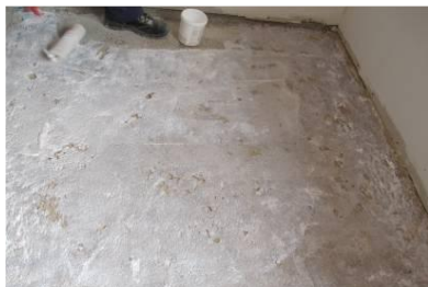
Aplicação do primário MICROART AD 21

Depois de misturado, verter o material sobre o pavimento, recorrendo a uma talocha ou espátula para nivelar a superfície. Se necessário passar o rolo de bicos para remover eventuais bolhas de ar.