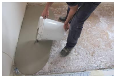
Aplicação do PLAN LEVEL 15/40