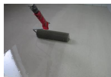
Lissage de la surface avec un rouleau à pointes