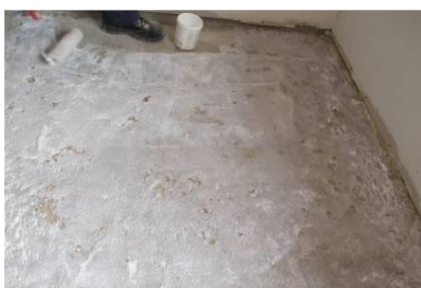
Application du primaire MICROART AD 21

Après le mélange, versez sur le sol, en utilisant une truelle ou une spatule pour uniformiser la surface. Si nécessaire, utilisez un rouleau à pointes pour éliminer les bulles d'air.