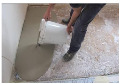
Application du PLAN LEVEL 315